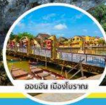
ฮอยอัน เมืองโบราณ