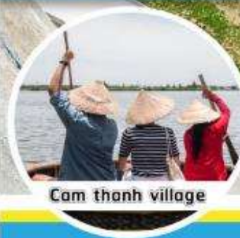
Cam thanh village