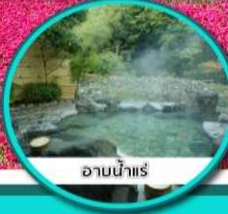
ออนน้ำแร่