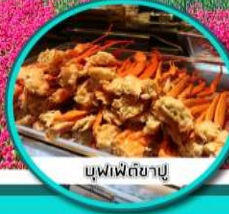
บุฟเฟ่ต์ซาปู