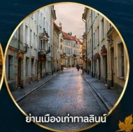
ย่านเมืองเก่าทาลลินน์