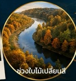
ช่วงใบไม้เปลี่ยนสี