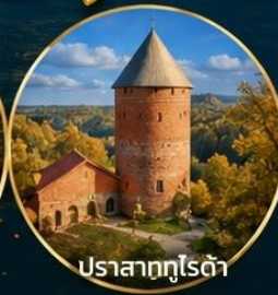
ปราสาทกูไรต้า