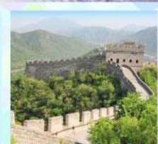
ตลาดร้อยปีเจิ้งหวิงเมี่ยว กำแพงเมืองจีน ด้านจวิยงกวน