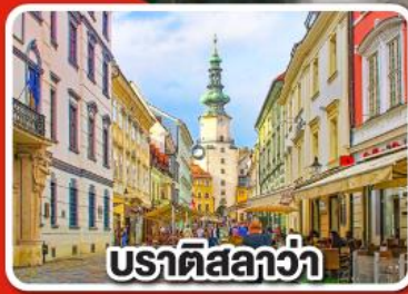
ปราตีสลลว่า

เที่ยวเมือง คาร์โลวารี เมืองแห่งสปา พร้อมเมนูพิเศษเปิดโบฮีเมีย