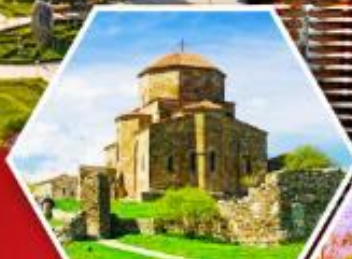
วิหารจอร์เจีย