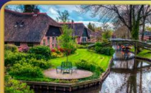
ล่องเรือหมู่บ้านไรกนทึร์น