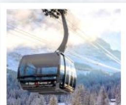
ขึ้นกระเช้ายอดเขาจุงเฟรา