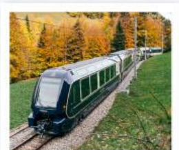
รถไฟโกลด์นพาส