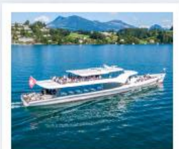
ล่องเรือทะเลสาบลูซีร์น