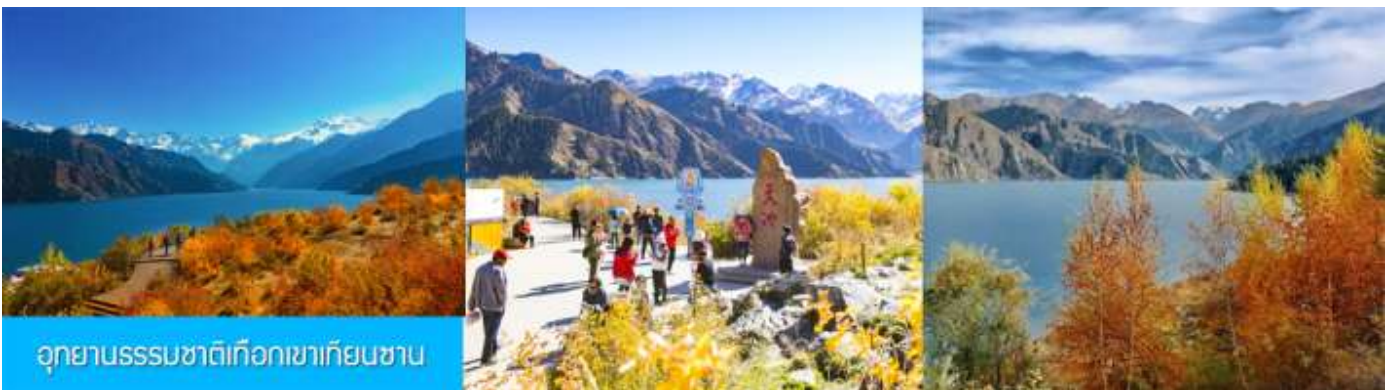
อุทยานธรรมชาติเทือกเขาเทียนชาน

เช้า รับประทานอาหารเช้า ณ ห้องอาหารของโรงแรม (7)