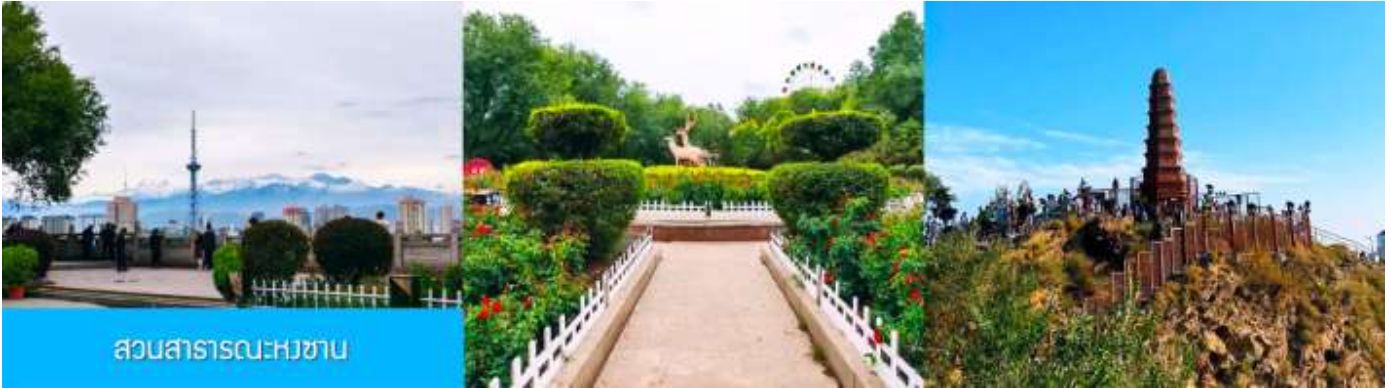
สวนสาธารณะหงซาน

โบราณนี้สร้างขึ้นในช่วงศตวรรษที่สองก่อนคริสตกาลโดยการขุดเจาะลงไปใต้พื้นดิน ภายในมีสิ่งปลูกสร้างโบราณที่มีคุณค่าทางประวัติศาสตร์ อาทิ กำแพง ป้อมปราการ ศาลาวัด และป่าเจดีย์ ฯลฯ จากนั้นนำท่านเดินทางโดยรถบัสสู่เมือง เมืองอูรูมูฉี 乌鲁木齐 (ระยะทาง 180 กม. ใช้เวลาเดินทางราว 2 ชั่วโมงครึ่ง)