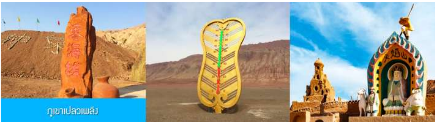
ภูเขาเปลวเพลิง

เช้า รับประทานอาหารเช้า ณ ห้องอาหารของโรงแรม (4)