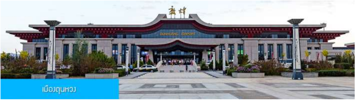
เมืองตุนหวง