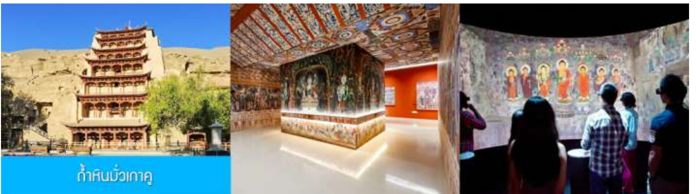
ถ้ำหินมั่วเกา

เช้า รับประทานอาหารเช้า ณ ห้องอาหารของโรงแรม (1)