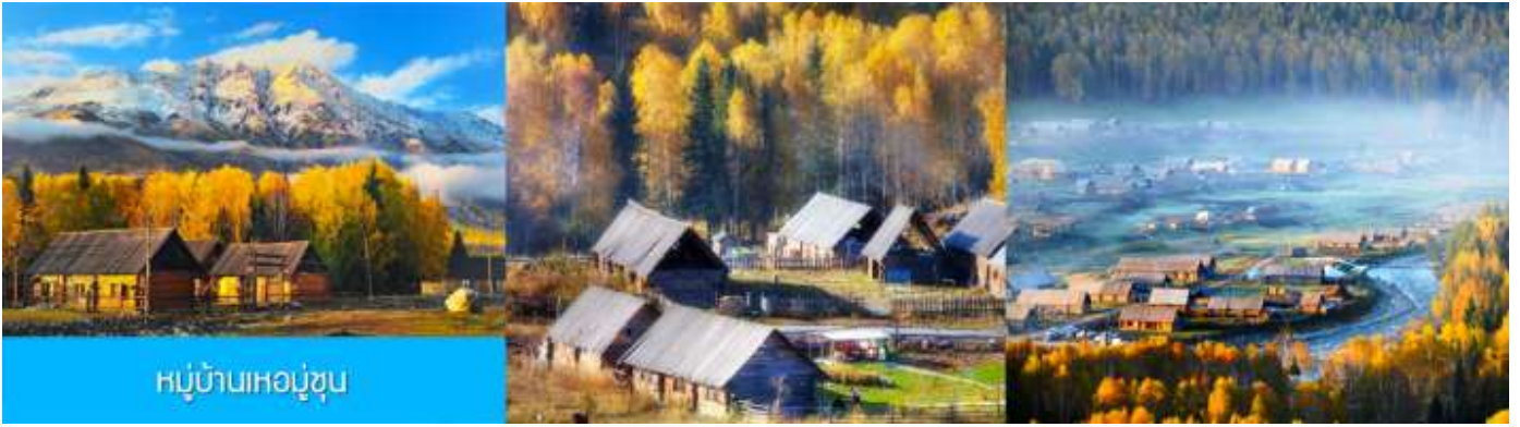
หมู่บ้านหอบู่ซุบ