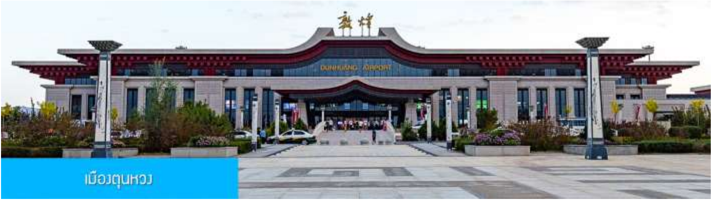
เมืองตุนหวง