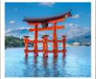
ศาลเจ้าอิโตสึกุชิมะ