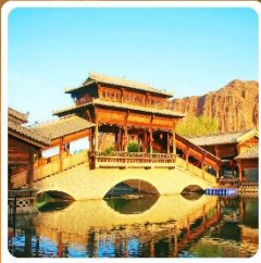
เมืองเล็กตันเสี๋ยชิว