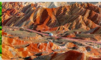
ภูเขาสายรุ้งจางเย่ต้นเสี่ย