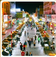
ตลาดกลางคินซาโจว