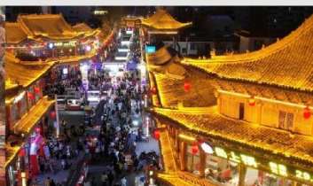
ตลาดกลางคืนจางเย่

*ทางบริษัทฯ ขอสงวนสิทธิ์ในการสลับโปรแกรมทัวร์ตามความเหมาะสมขึ้นอยู่กับสถานการณ์หน้างาน โดยคำนึงถึงผลประโยชน์ของลูกค้าเป็นสำคัญ