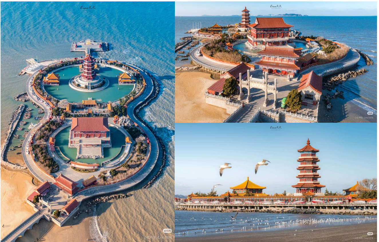
T2G-DLCTA001CZ ล่องเรือข้ามอ่าว ดำเหลียน ชิงเต่า...เหยียนไถ เว่ยไห่ เผิงไห่ 6D 5N (CZ)