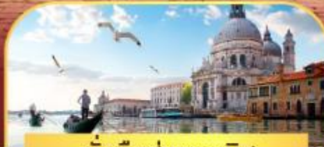
นั่งเรือสู่เกาะเวนิส