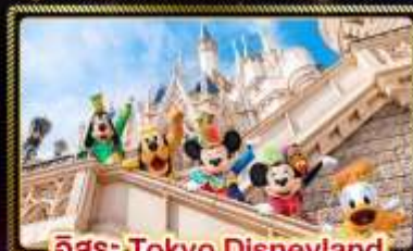
อิสระ Tokyo Disneyland