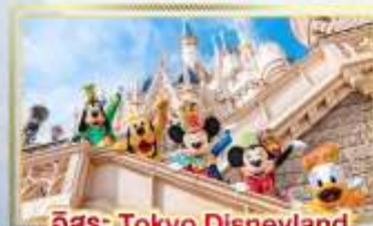
อีกระ : Tokyo Disneyland