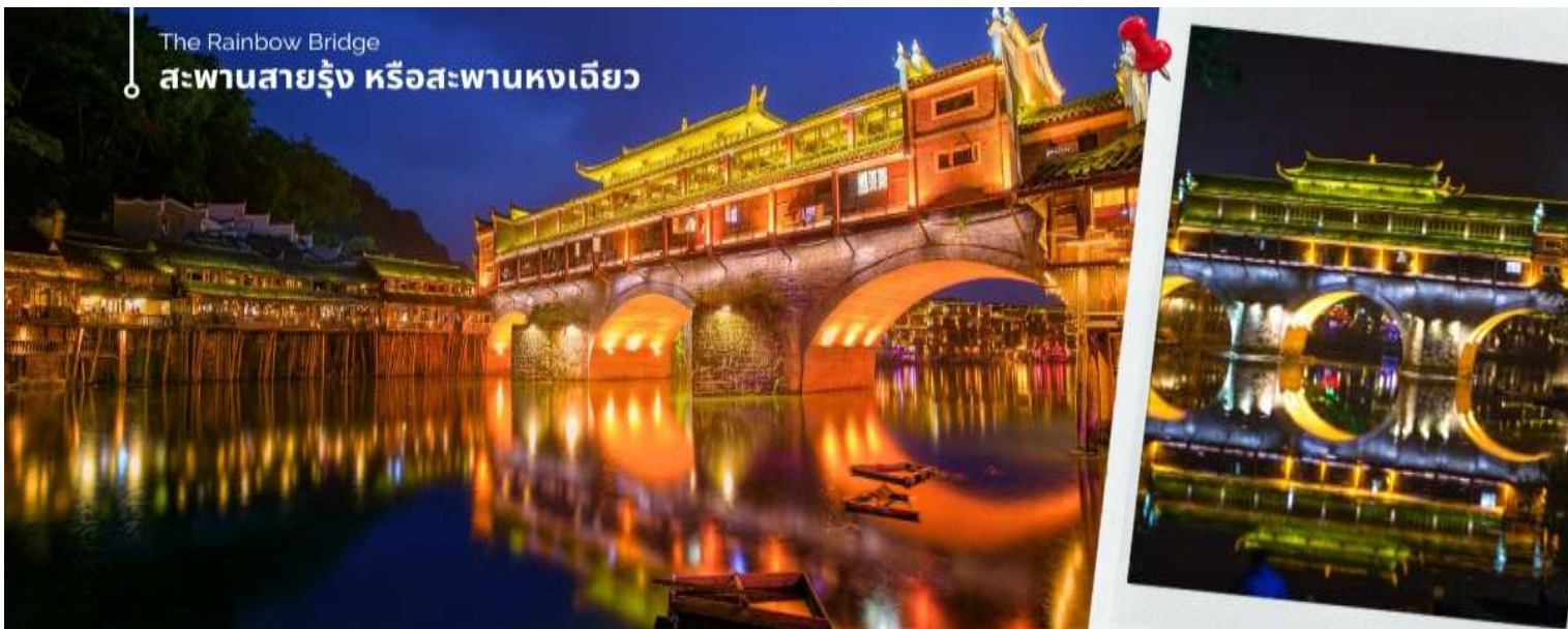
The Rainbow Bridge สะพานสายรุ้ง หรือสะพานหงเจียว

นำท่านชม สะพานสายรุ้ง (The Rainbow Bridge) หรือสะพานหงเจียว เป็นสะพานไม้โบราณที่มีหลังคาคลุมเหมือนสะพานข้ามคลองในเวนิส ตั้งอยู่ในเมืองเฟิ่งหวาง จุดเด่นอีกแห่งหนึ่งที่อยู่ใกล้สะพานนี้ก็คือ บ้านบริเวณที่สะพานหงเจียว จยกพื้นสูงเรียงรายกันบนริมน้ำที่ใสสะอาดจนเห็นกันบึง ซึ่งเป็นทัศนียภาพที่สวยงาม ที่ทั้งชาวจีนและชาวต่างประเทศนิยมเดินทางมาเที่ยวชมที่นี่ ชมแสงสียามค่ำคืนของเมืองเก่า จุดไฮไลท์ที่ขึ้นชื่อของเมืองแห่งนี้