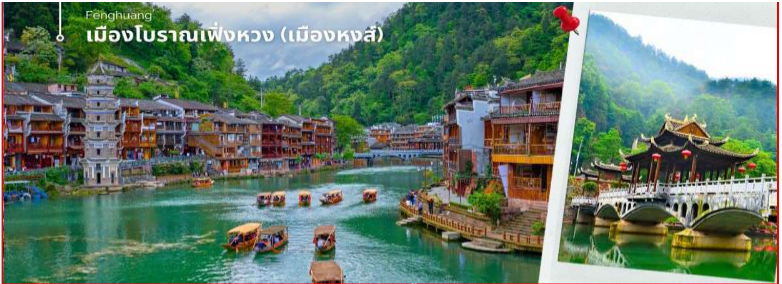
Fenghuang เมืองโบราณเฟิ่งหวง (เมืองหงส์)

รถของอุทยานเฟิ่งหวง นำท่าน นั่งเรือพายล่องแม่น้ำถั่วเจียง ชมบ้านเรือนโบราณห้อยขาสองฝั่งแม่น้ำถั่วเจียงอันเป็นเอกลักษณ์ของเมืองโบราณแห่งนี้ สัมผัสวิถีชีวิตที่ของชนเผ่าพื้นเมืองที่อาศัยอยู่บริเวณชุมชนนี้มาช้านาน