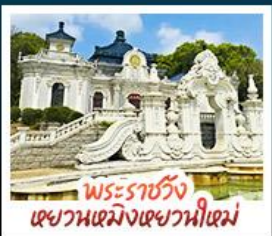
พระราชวัง เขาวงมั่งเขาวงหนีเมม