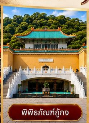
พิพิธภัณฑที่กู๊กง