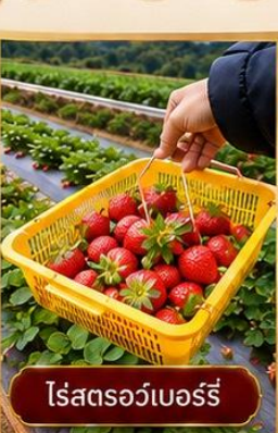
ไร่สตอร์วเบอร์รี่