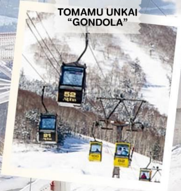
TOMAMU UNKAI “GONDOLA”