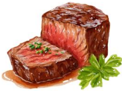
● เนื้อวัว

ขอความกรุณาแจ้งวัตถุประสงค์ที่ท่าน แพ้หรือไม่สามารถรับประทานได้