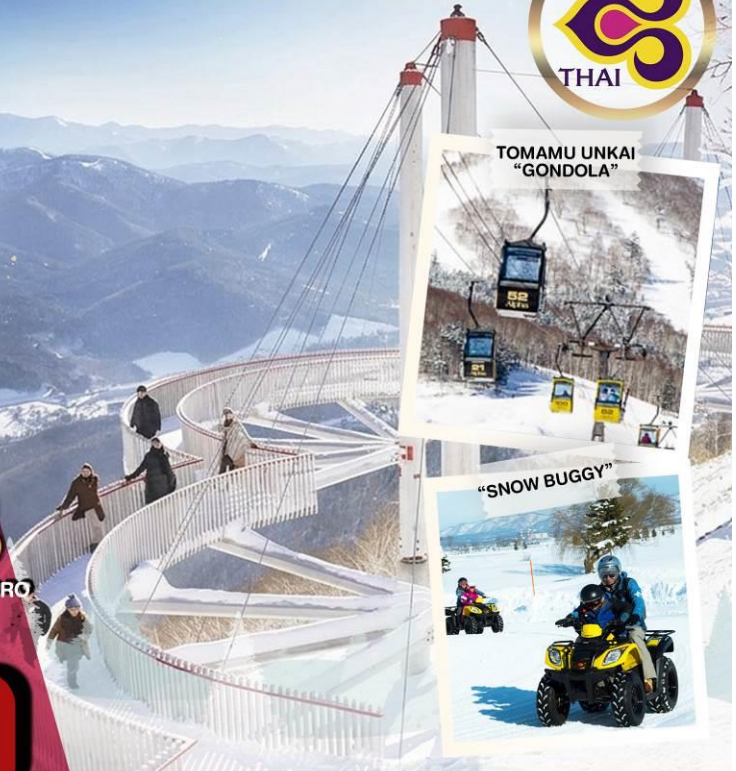
TOMAMU UNKAI "GONDOLA"