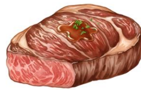
● เนื้อหมู