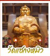
วัดเซกุงเมิว