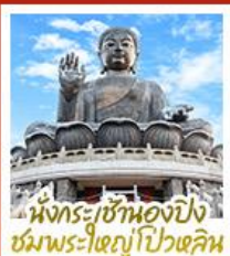
นั่งกระเช้ามองปิง ชมพระใหญ่ปัวหลิม

นั่งกระเช้ามองปิงสักการะพระใหญ่ปัวหลิม • วัดหวังต้าเซียน ขอพรสุขภาพ ความรัก วิชาแขนงหิว ขอพรองค์เซกุง โชคลาภ การเงินและธุรกิจ • เจ้าแม่กวนอิมรพีลาสีย์ รับพลังงานดี เสริมพลังฮวงจุ้ย • วัดมื่นไทมว ขอพรเรื่องการศึกษ การงาน สติปัญญาและความกล้าหาญ