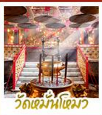
วัดเม้านี้เมิว