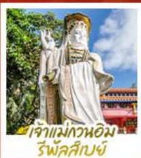
เจ้าแม่กวนอิม รพีลาสีย์