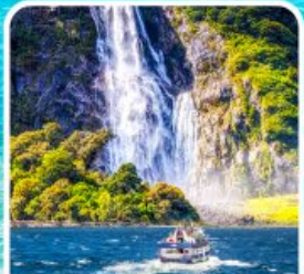
บิลฟอร์ด ซาวด์ นั่งเรือชมความงาม ฟยอร์ด