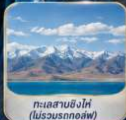
ทะเลสาบซิงไห่ (ไม่รวมรถกอล์ฟ)