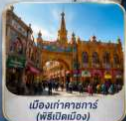
เมืองเก่าคาซการ์ (พิธีเปิดเมือง)