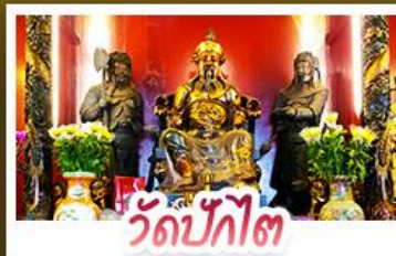
วัดปักไต้