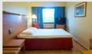
Double สำหรับ 2 ท่าน