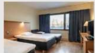
Triple สำหรับ 3 ท่าน