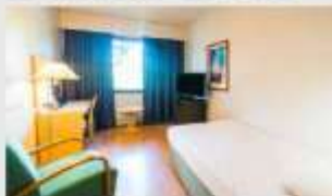
Single สำหรับ 1 ท่าน