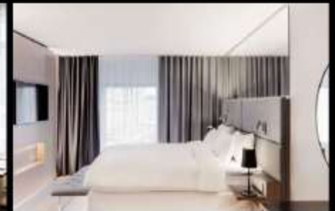
***รูปภาพเพื่อประกอบการโฆษณาเท่านั้น***