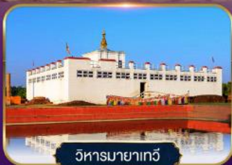
วิหารมายาเกวี