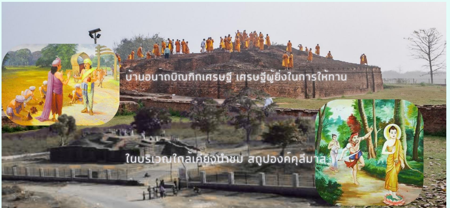
บ้านอนาถบิณฑิกกเศรมชฐี เศรมชฐีผู้ยั้งในการให้กาบ