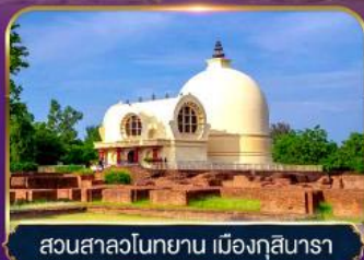
สวนสาละวินทยาน เมืองกุสินารา