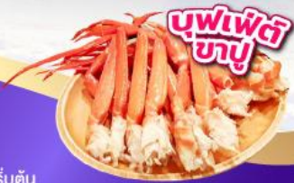
บุฟเฟ่ต์ 3 อย่าง