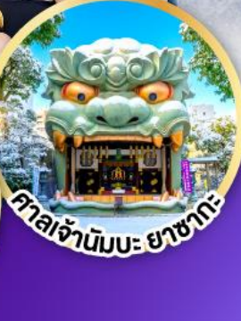
ศาลเจ้ามิมะ ยามากะ