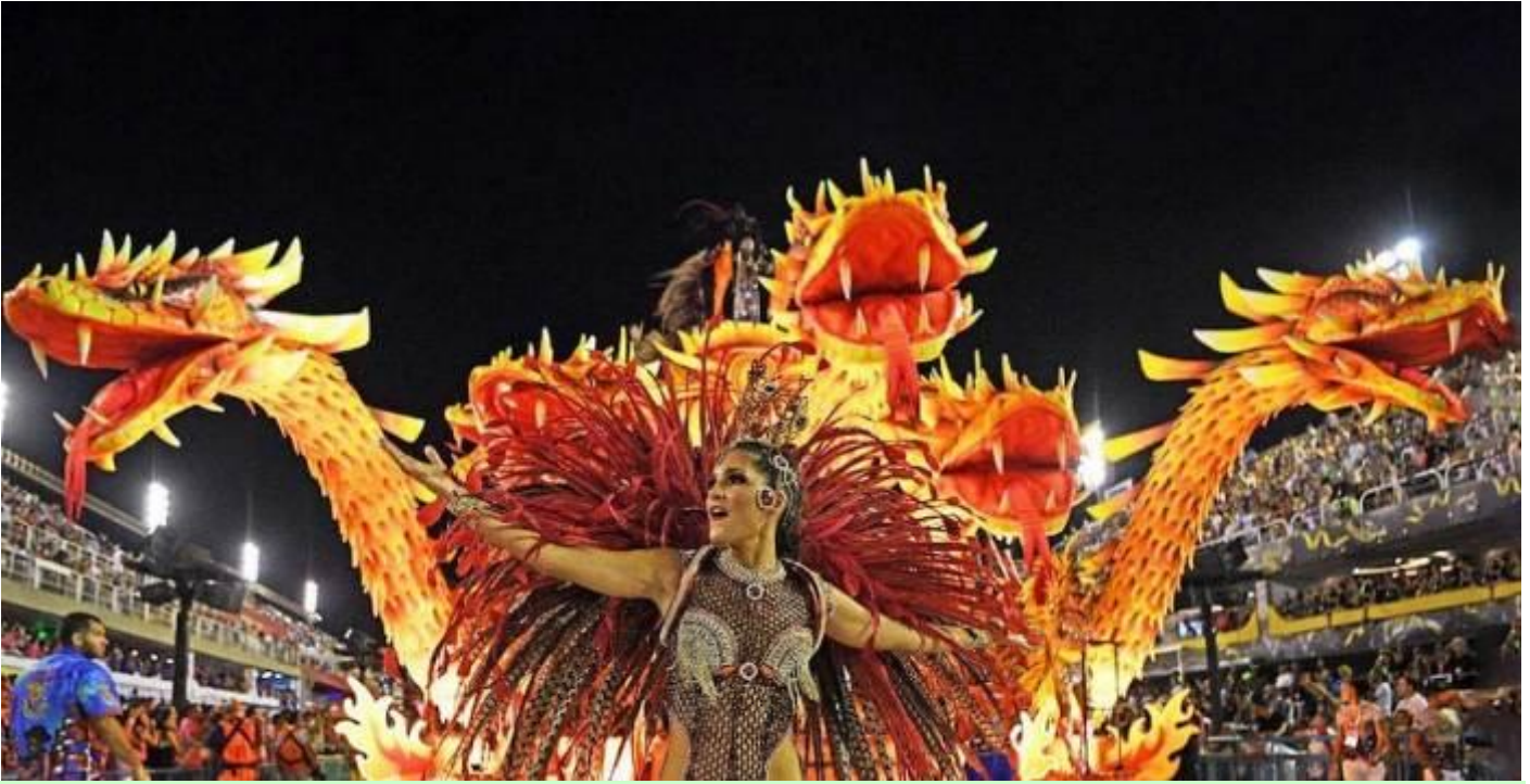
14 ก.พ. 2570 ป้อมโคปาคาบานา - ปาร์เก ลาจ - ลิมา (เปรู)