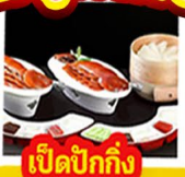
เปิดปิ้งกั๊ง