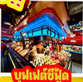
บูฟเฟต์ซี่ฟู้ด