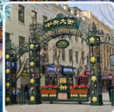
ถนนจางยาง