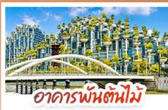
อาคารพันตันใหม่