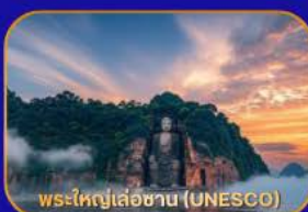
พระใหญ่เล่อซาน (UNESCO)

ล่องเรือชม "พระใหญ่เล่อซาน" - เมืองโบราณหวงหลงซี - แพนด้าเซลฟี - ห้างสรรพสินค้า - Wangjianglou Park - ถนนชุนซีลู่ (แหล่งช้อปปิ้ง) - IFS (แพนด้าปีนตึก) - วัดต้าเจี๋ย