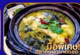
มีอพิเศษ! ปลาต้มผักกาดดอง