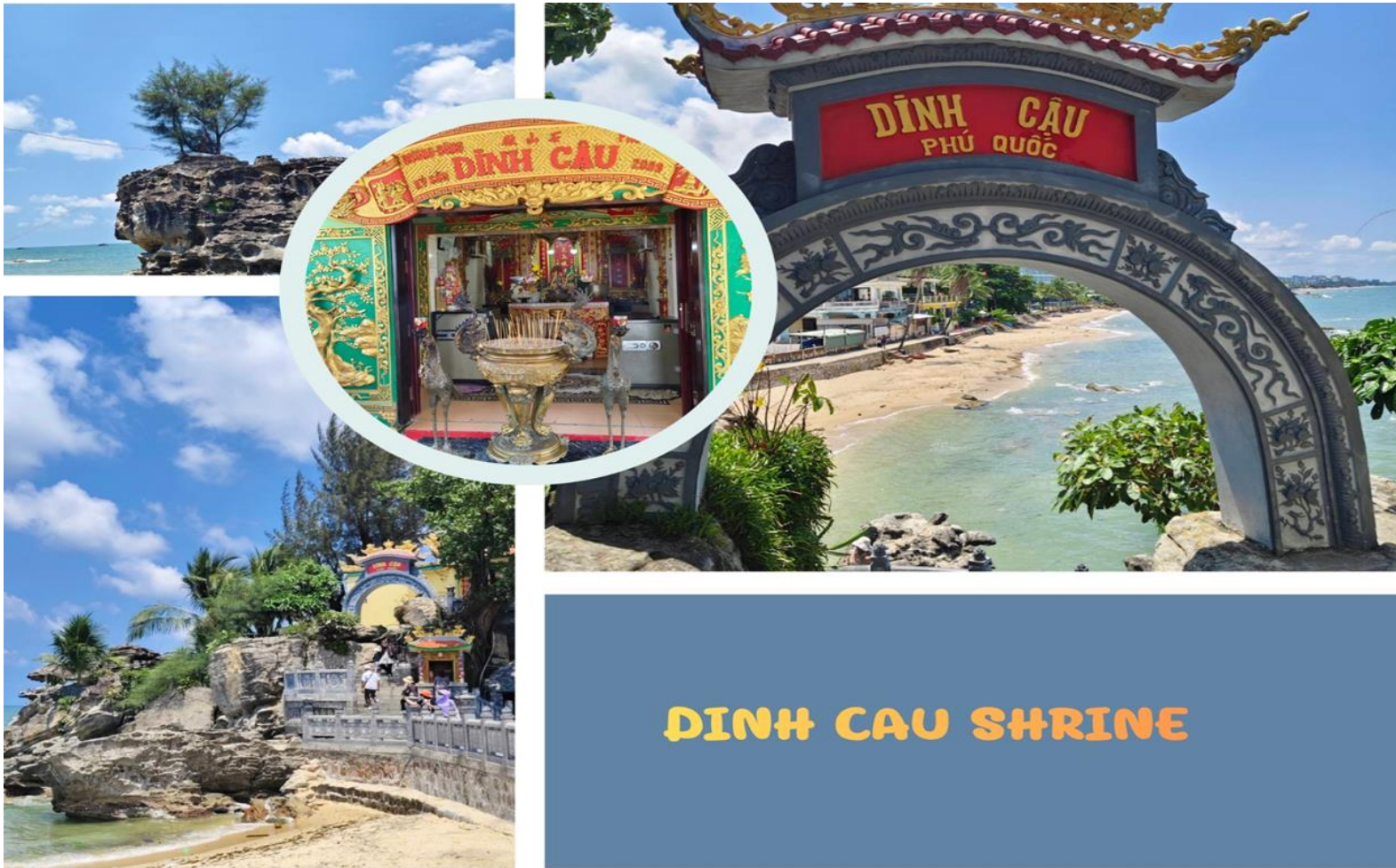
DINH CAU SHRINE

เช้า รับประทานอาหารเช้า ณ ห้องอาหารของโรงแรม ( มื้อที่ 4 )