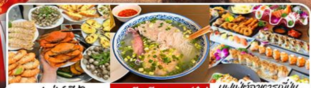
บุฟเฟ่ต์ซีฟู้ด | มุมจีนริวจิดนัม (ญี่ปุ่น) | บุฟเฟ่ต์อาหารญี่ปุ่น Bababa Japanese Restaurant