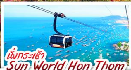
นั่งกระเช้า Sun World Hon Thom