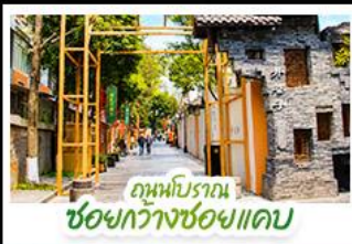
ถนนโบราณ ซอยกว้างชอยแคบ