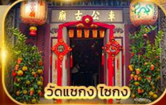
วัดแขก ไชกง