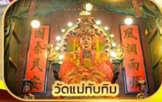
วัดแม่ทับทิม