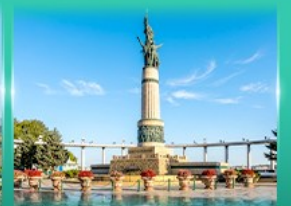
อนุสาวรีย์มังกร