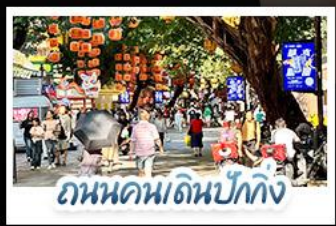
ถนนคนเดินปักกิ่ง