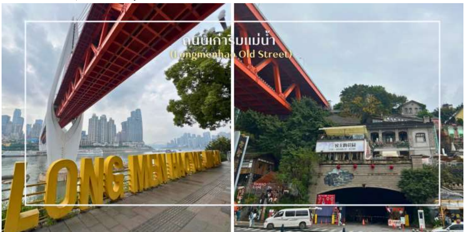
ถนนเก่าริมแม่น้ำ (Longmenhao Old Street)

นำท่านสู่ ถนนโบราณหลงเหมินฮ่าว (Longmenhao Old Street) ถนนเก่าริมแม่น้ำอีกหนึ่งแลนด์มาร์กสำคัญของเมืองฉงชิ่ง ถนนสายนี้เคยเป็นย่านการค้าและศูนย์กลางเศรษฐกิจที่รุ่งเรืองในยุคราชวงศ์หมิงและชิง ปัจจุบันได้รับการอนุรักษ์ไว้อย่างดี เพื่อเป็นแหล่งเรียนรู้ทางประวัติศาสตร์ และแหล่งท่องเที่ยวเชิงวัฒนธรรมที่เต็มไปด้วยเสน่ห์บรรยากาศของถนนยังคงอบอวลไปด้วยกลิ่นอายวันวาน อาคารบ้านเรือนแบบโบราณผสมผสานกับร้านค้า ร้านอาหาร และแกลเลอรีร่วมสมัยอย่างลงตัว อีกทั้งยังเป็นจุดชมวิวแม่น้ำที่โดดเด่น สามารถมองเห็นสะพานข้ามแม่น้ำแยงซีและทัศนียภาพของเมืองฉงชิ่งในมุมที่สวยงาม และอีกหนึ่งจุดหมายที่สะท้อนเสน่ห์ดั้งเดิมของที่นี่คือ Xiahaoli Old Street ตรอกชอกชอยแคบ ๆ บันไดหิน และสถาปัตยกรรมไม้โบราณที่ยังคงกลิ่นอายของวิถีชีวิตในอดีต แม้ในปัจจุบันจะได้รับการบูรณะและพัฒนาให้เหมาะกับการท่องเที่ยว ก็ยังคงรักษาบรรยากาศคลาสสิกเอาไว้ได้อย่างดี