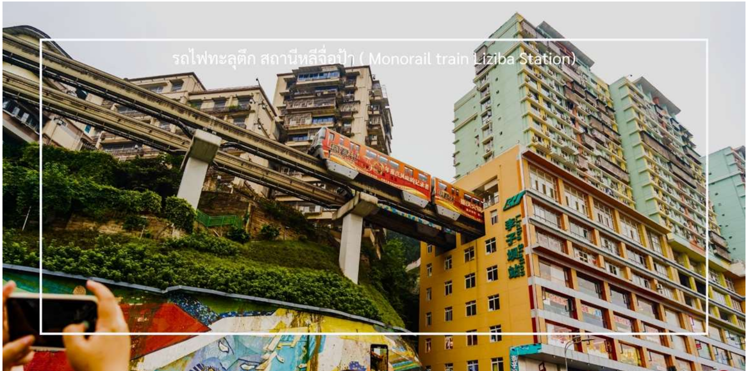
รถไฟฟ้าลูตึก สถานีหลี่จื่อเป่า (Monorail train Liziba Station)

ถ่ายภาพโมเมนต์สุดล้ำนี้จากมุมต่างๆ ของเมือง จุดชมวิวนี้ไม่เพียงสร้างความตื่นตาตื่นใจ แต่ยังเป็นสัญลักษณ์ของการผสมผสานระหว่างเมืองสมัยใหม่กับภูมิประเทศที่มีภูเขาและแม่น้ำรายล้อม