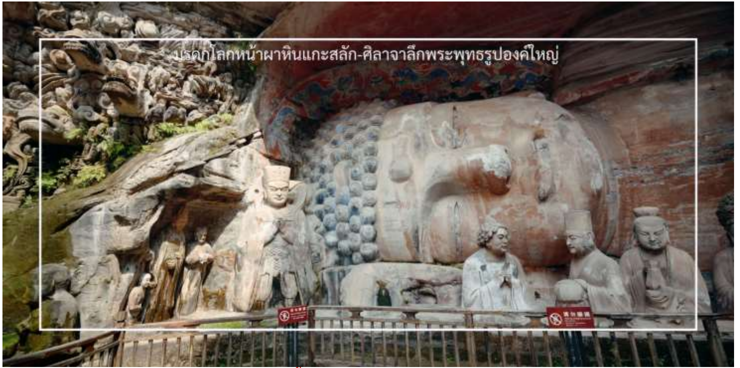
บรรดากลมหินหน้าผาหินแกะสลัก-ศิลาจากลึงพระพุทธรูปองค์ใหญ่