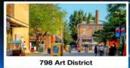
798 Art District