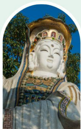
เจ้าแม่กวนอิม ธิพลสัย