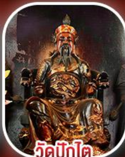
วัดปึกไต่