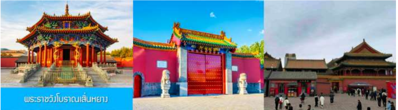
พระราชวังโบราณเสียนหยาง

รับประทานอาหารเช้า ณ ห้องอาหารของโรงแรม (1)