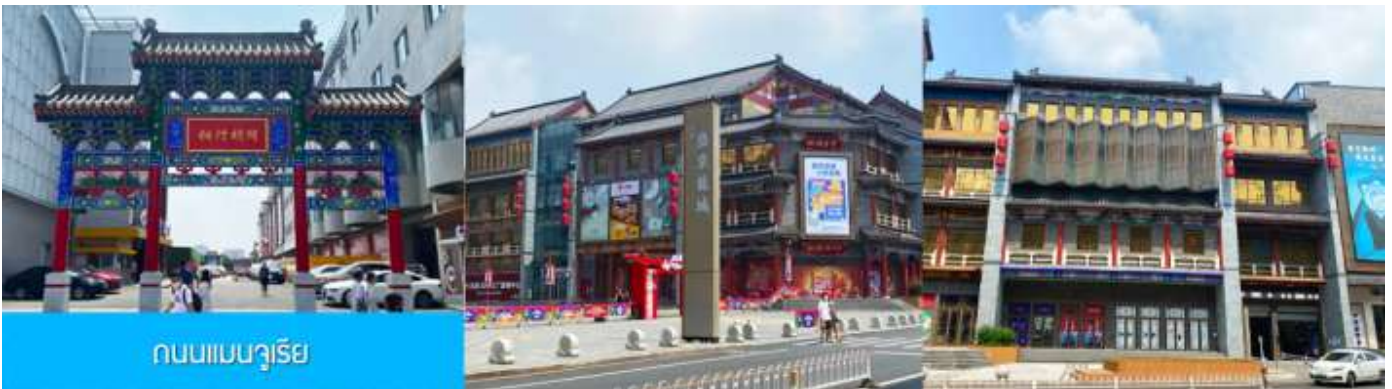
ถนนแมนจูเรีย