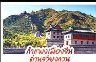
กำแพงเมืองจีน ด้านจวิ้นกวน

ล่องเรือสุดโรแมนติกแม่น้ำหวงหู ปักกิ่ง..เปิดประตูสู่แดนมังกร ด้วยความอลังการระดับจักรพรรดิ ชิงเต่า..เมืองชายทะเลสไตล์ยุโรป หอหุราแบบพอนทอเรียล เซี่ยงไฮ้..มหานครแห่งเอเชีย เมืองที่ไม่เคยหลับใหล