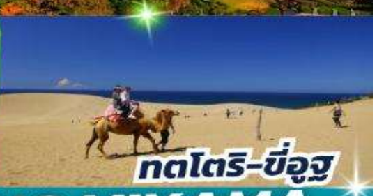
กตโตริ-ขี่อูฐ