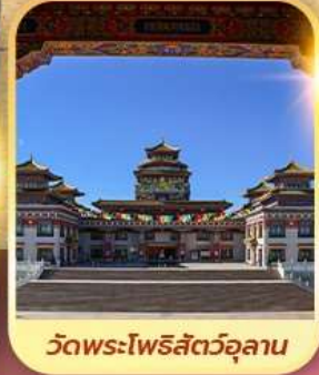
วัดพระโพธิสัตว์อูลาน