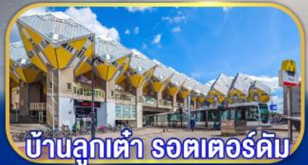
บ้านลูกเต่า รถเตอร์ดัม

เยือนเมืองเก่าแก่ยุโรป ทั่วมหานครกลุ่มประเทศเบเนลักซ์ กับการบินไทย บินตรงอัมสเตอร์ดัม