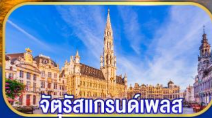
จัตุรัสแกรนด์เพลส