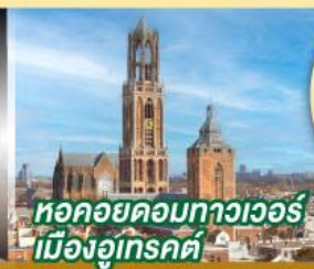
หอคอยดอกทิวลิป เมืองอูเทรคต์