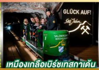
เหมืองเกลือเบิร์ชเทสกาเดิน