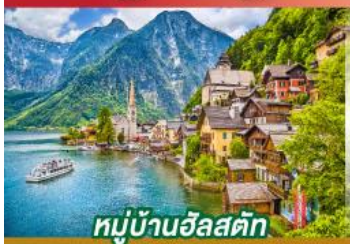
หมู่บ้านอัลสตัด