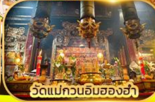
วัดแม่กวนอิมของฮ่า