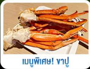
เมนูพิเศษ! ซาซิมิ