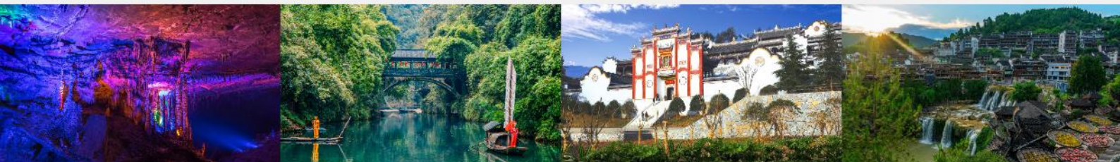
ต้าเก้าเทพ