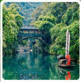
หมู่บ้านซานเสี่ยเหรินเจีย