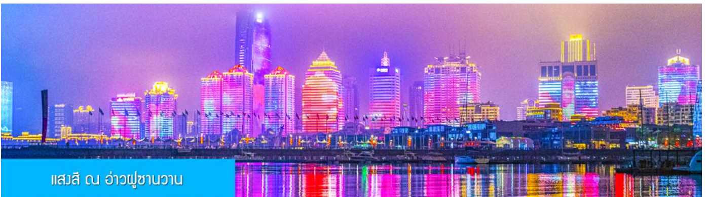
แอสสิ ณ อ่าวภูเขาหวาน

ค่า รับประทานอาหารค่ำ ณ ภัตตาคาร *เมนูซีฟู้ด (3)