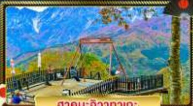
อาคิบุะ:ชิงากาตะ